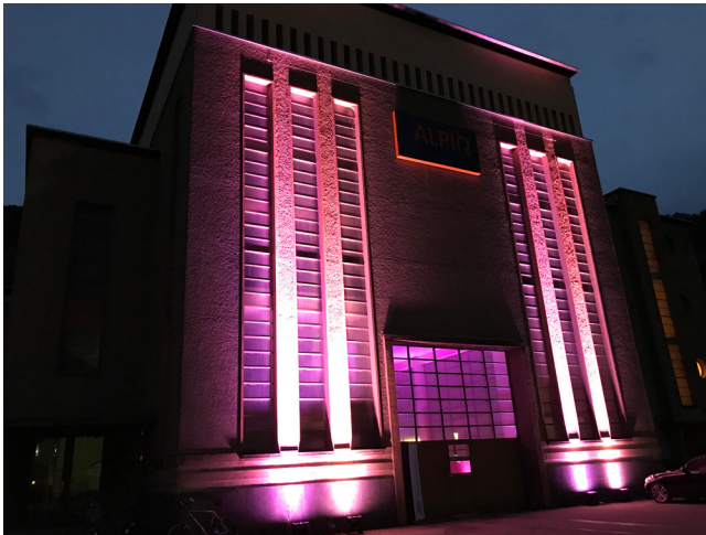
20 Jahre Screening-Zentrum in der Usine de Chandoline

Im Jahr 2019 wurden im Rahmen des kantonalen Programms 13'868 Mammographien durchgeführt. Um der Empfehlung der Swiss Cancer Screening nachzukommen und die positive Wirkung des Mammographie-Screenings zu verstärken, lädt das Zentrum neu automatisch Frauen im Alter von 50 bis 74 Jahren ein (bisher auf Anfrage von 70 bis 74 Jahren).